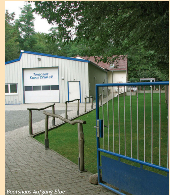
Bootshaus Aufgang Elbe

Auf dem Wasser und am Land, eine gute Adresse für Jedermann.