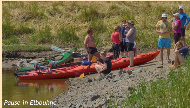
Pause in Elbbühne

Unser Bootshaus soll für Mitglieder und Gäste ein Ort des Sports, der Ruhe und Erholung sein.