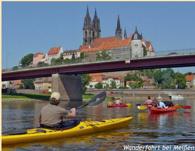
Wanderfahrt bei Meißen

Seit 1930 begeistert der Torgauer Kanu Club Paddelinteressierte aus Torgau und Umgebung. In der Renaissancestadt Torgau an der Elbe, nicht allzu fern vom Leipziger Seenland, befindet sich unser schönes Bootshaus. Wir sind ein Verein, der sich nicht nur zum Paddeln trifft, sondern auch zum Training im hauseigenen Krafraum, zum Volleyball spielen, beim Schwimm- und Winterwassertraining in der ortsansässigen Schwimmhalle oder zu Wochenendausflügen auf Skiern. Neben dem sportlichen Aspekt beinhaltet unser Vereinsleben auch gemeinsame kulturelle Aktivitäten sowie gemütliches Beisammensein.